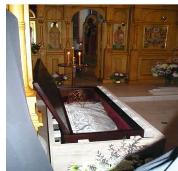
Châsse du Saint père Alexis d'Ugine

Un Molébène devant les reliques du Saint Prêtre Alexis d'Ugine peut être célébré selon votre demande.