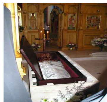
Châsse du Saint père Alexis d'Ugine

Un Molébène devant les reliques du Saint Prêtre Alexis d'Ugine peut être célébré selon votre demande.