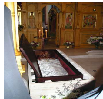
Châsse du Saint père Alexis d'Ugine

Un Molébène devant les reliques du Saint Prêtre Alexis d'Ugine peut être célébré selon votre demande.