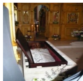
Châsse du Saint père Alexis d'Ugine

Un Molébène devant les reliques du Saint Prêtre Alexis d'Ugine est célébré les mardis à 18h30, (sauf périodes de fêtes et Grand Carême)