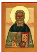
Saint Père Alexis d'Ugine

Molébène est célébré devant les reliques du Saint Prêtre Alexis d'Ugine les mardis à 18h30, Un Acathiste à la Mère de Dieu est célébré le premier jeudi de chaque mois à 18h30