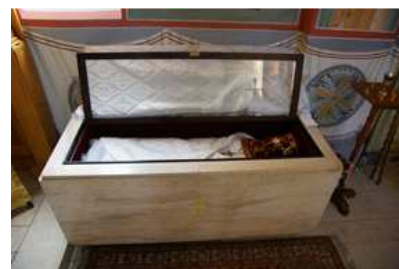
Châsse du Saint père Alexis d'Ugine

Un Molébène devant les reliques du Saint Prêtre Alexis d'Ugine peut être célébré selon votre demande.