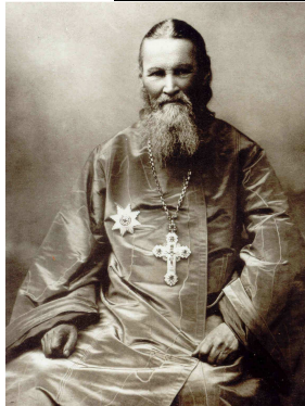
Saint Jean de Cronstadt