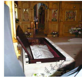
Châsse du Saint père Alexis d'Ugine