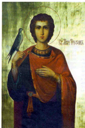
Saint martyr Tryphon

Avant fête de la Sainte Rencontre saint martyr Tryphon