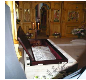
Châsse du Saint père Alexis d'Ugine