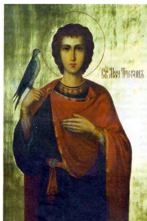
Saint martyr Tryphon

Avant fête de la Sainte Rencontre saint martyr Tryphon