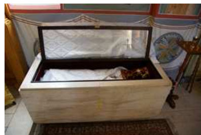
Châsse du Saint père Alexis d'Ugine

Un Molébène devant les reliques du Saint Prêtre Alexis d'Ugine peut être célébré selon votre demande.