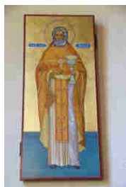
Saint Père Alexis d'Ugine

Un Molébène devant les reliques du Saint Prêtre Alexis d'Ugine peut être célébré selon votre demande.