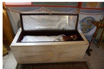
Châsse du Saint père Alexis d'Ugine

Un Molébène devant les reliques du Saint Prêtre Alexis d'Ugine peut être célébré selon votre demande.