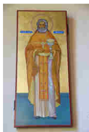
Saint Père Alexis d'Ugine

Un Molébène devant les reliques du Saint Prêtre Alexis d'Ugine peut être célébré selon votre demande.