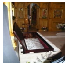
Châsse du Saint père Alexis d'Ugine

Un Molébène devant les reliques du Saint Prêtre Alexis d'Ugine est célébré les mardis à 18h30, (sauf périodes de fêtes)