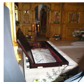
Châsse du Saint père Alexis d'Ugine