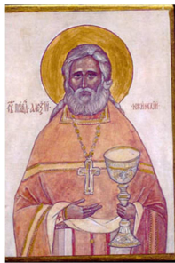
Saint Père Alexis d'Ugine

Il est prudent de téléphoner pour s'assurer qu'il n'y a pas de changement d'horaire