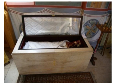
Châsse du Saint père Alexis d'Ugine