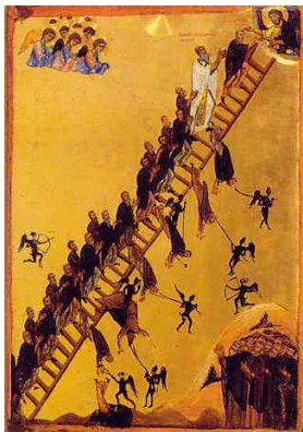
Echelle de saint Jean Climaque