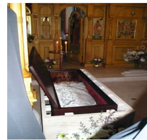
Châsse du Saint père Alexis d'Ugine

Un Molébène devant les reliques du Saint Prêtre Alexis d'Ugine peut être célébré selon votre demande.