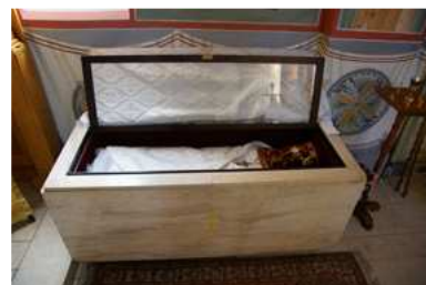
Châsse du Saint Père Alexis d'Ugine

Un Molébène peut être célébré devant les reliques du Saint Prêtre Alexis d'Ugine selon votre demande.