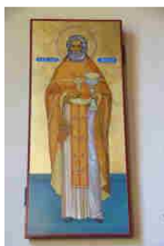
Saint Père Alexis d'Ugine

Un Molébène peut être célébré devant les reliques du Saint Prêtre Alexis d'Ugine selon votre demande.