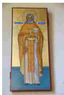
Saint Père Alexis d'Ugine

Il est prudent de téléphoner pour s'assurer qu'il n'y a pas de changement d'horaire