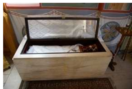
Châsse du Saint père Alexis d'Ugine

Un Molébène devant les reliques du Saint Prêtre Alexis d'Ugine est célébré le mardi après les Vêpres, sauf pendant le Grand Carême et les Grandes Fêtes avec leur Octave.