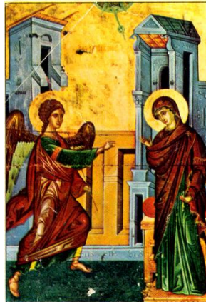
Vêpres et Matines