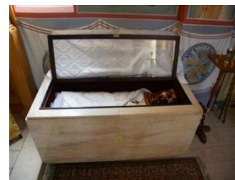
Châsse du Saint père Alexis d'Ugine

Un Molébène devant les reliques du Saint Prêtre Alexis d'Ugine est célébré les mardis à 18h30, (sauf périodes de fêtes)