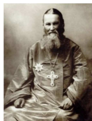
Saint Jean de Cronstadt

Epîtres : Hb XII 25-26, XIII 22-25 Hb IV 14-V 6