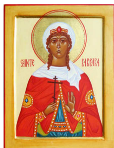
Sainte Grande Martyre Barbara