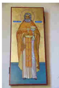
Saint Père Alexis d'Ugine

Il est prudent de téléphoner pour s'assurer qu'il n'y a pas de changement d'horaire