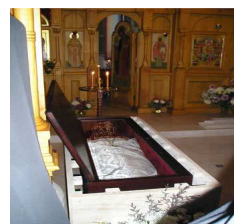
Châsse du Saint père Alexis d'Ugine