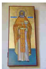
Saint Père Alexis d'Ugine

Il est prudent de téléphoner pour s'assurer qu'il n'y a pas de changement d'horaire