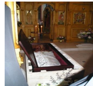
Châsse du Saint père Alexis d'Ugine

Un Molébène devant les reliques du Saint Prêtre Alexis d'Ugine est célébré les mardis à 18h30, (sauf périodes de fêtes)