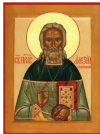
Saint Père Alexis d'Ugine

Un Molébène devant les reliques du Saint Prêtre Alexis d'Ugine est célébré les mardis à 18h30, (sauf périodes de fêtes)