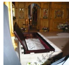
Châsse du Saint père Alexis d'Ugine

Un Molébène devant les reliques du Saint Prêtre Alexis d'Ugine est célébré le mardi après les Vêpres, sauf pendant le Grand Carême et les Grandes Fêtes avec leur Octave.