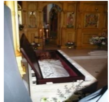
Châsse du Saint Père Alexis d'Ugine

Un Acatiste à la Mère de Dieu est célébré Le premier jeudi de chaque mois à 18h30